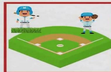
The baseball field