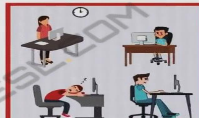
The computer room