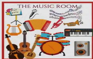
The music room