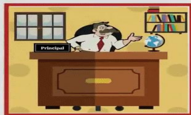
The Principal's office