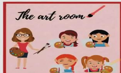
The art room